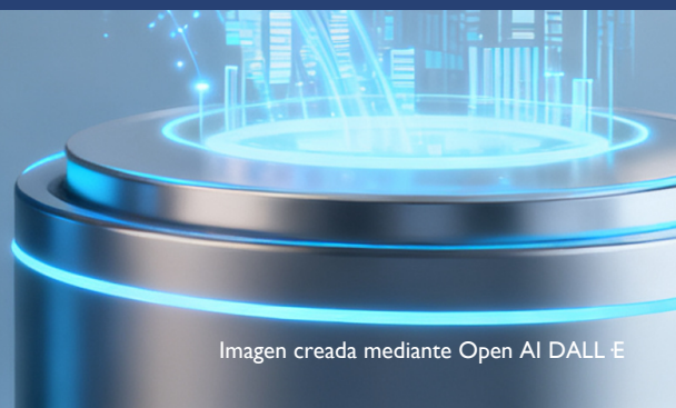
Imagen creada mediante Open AI DALL E